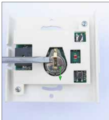
2. Demontera knappcellerna med skruvmejsel. Dessa skjuts loss i sidled.