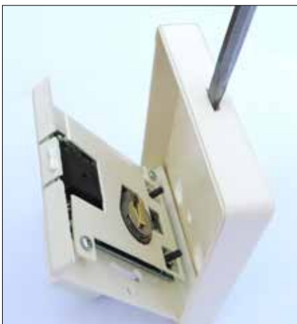
1. Öppna locket genom att försiktigt trycka upp snäplåset med en liten skruvmejsel

Indikerar blytljuset utomhus = kontakta Gästrike Vatten Om inte blytljuset indikerar utomhus, men larmet inomhus signalerar = kontrollera pump och larmsäkringarna inne i elcentralen och ute i pumpstationen. Är säkringarna hela, byt batterier i larmenhet enligt följande instruktion.