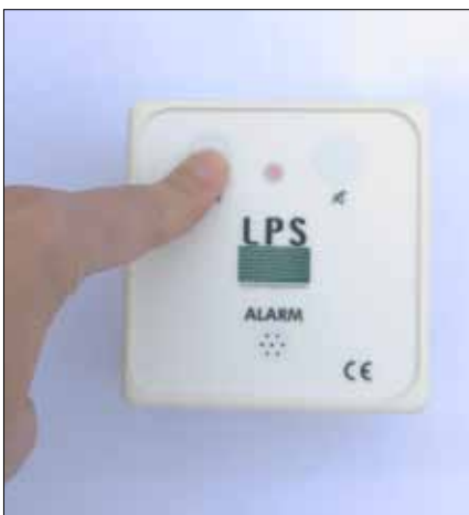
Testa larmet genom att trycka på larmknapp till vänster. Larmet ska då ge ifrån sig ljud samt lysa.