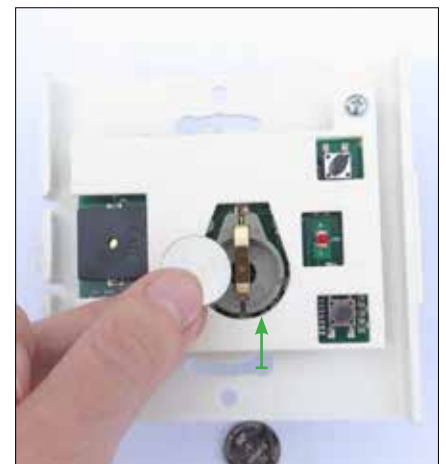
3. Montera de nya knappcellerna för hand, 2 st ovanpå varandra. Dessa skjuts tillbaka i omvänd ordning, under metallskenan.