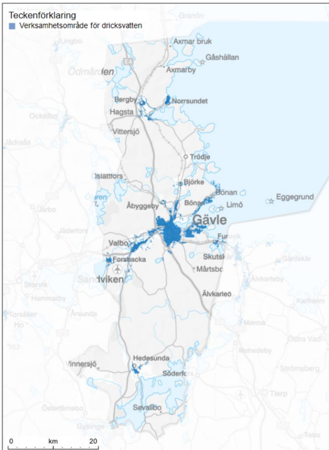
Figur 2. Verksamhetsområden för dricksvatten inom Gävle kommun.