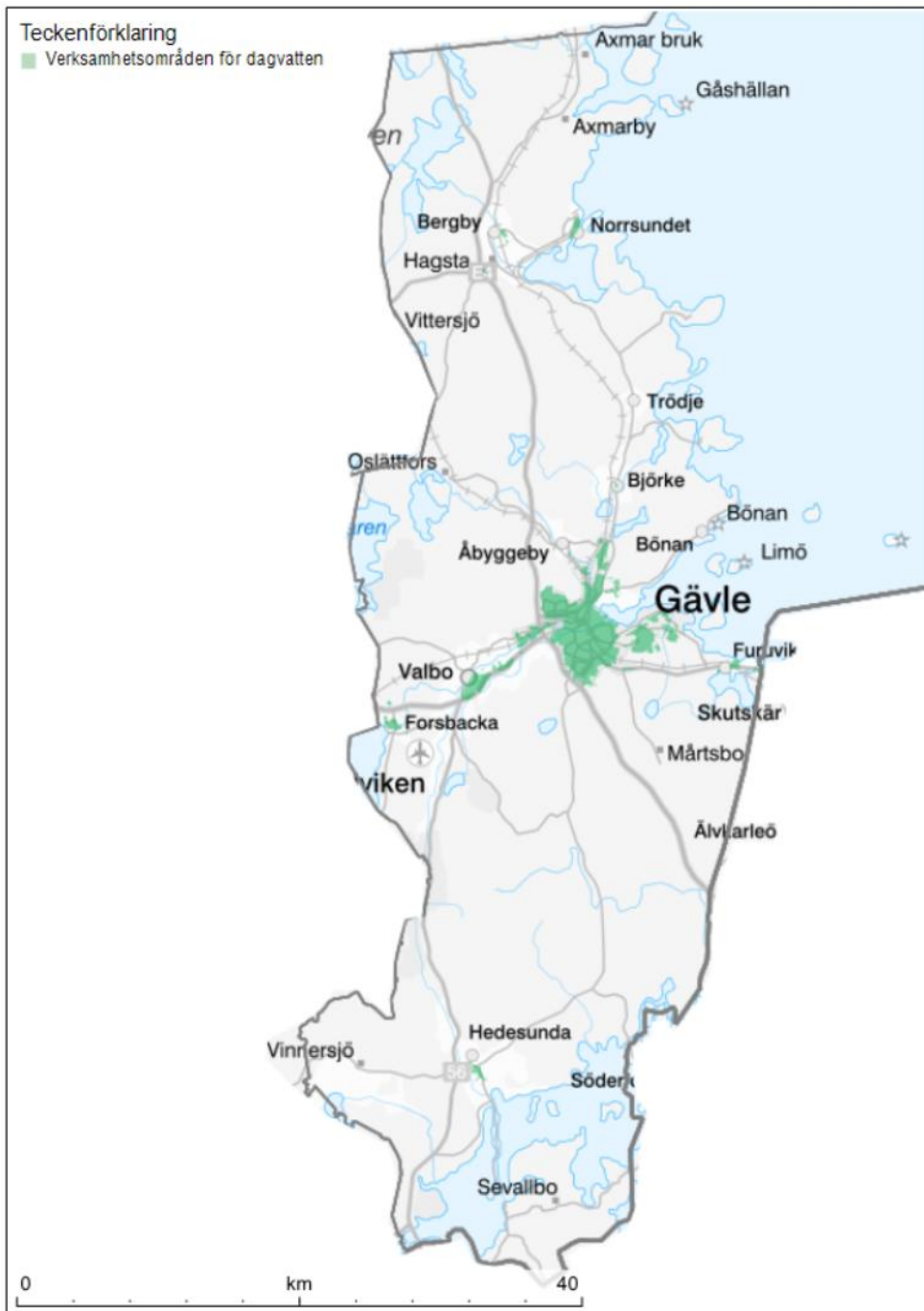
Figur 4. Verksamhetsområden för dagvatten inom Gävle kommun.